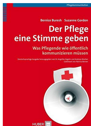
Buresh, Gordon - Hogrefe/Huber 2006